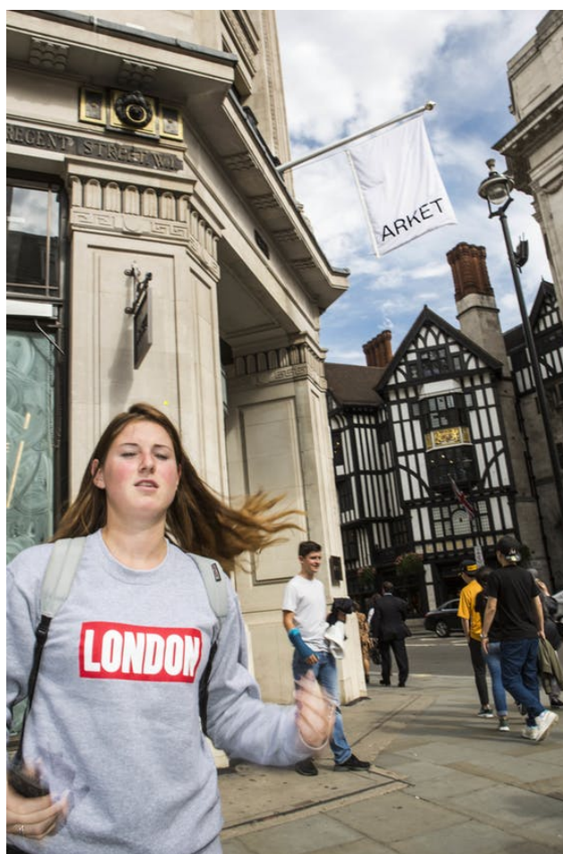
London new H&M brand store Arket will open on 25 august 2018 Regent Street London

De klant van de toekomst gaat volgens de Scandinaviërs niet meer in de rij staan voor advies. In Arket, Zweeds voor 'vel papier', is de eigen telefoon de verkoopadviseur. Daarop bekijk je kledingstukken in verschillende kleuren of materialen, of de huidige versies van een favoriete sweater met informatie over het productieproces.