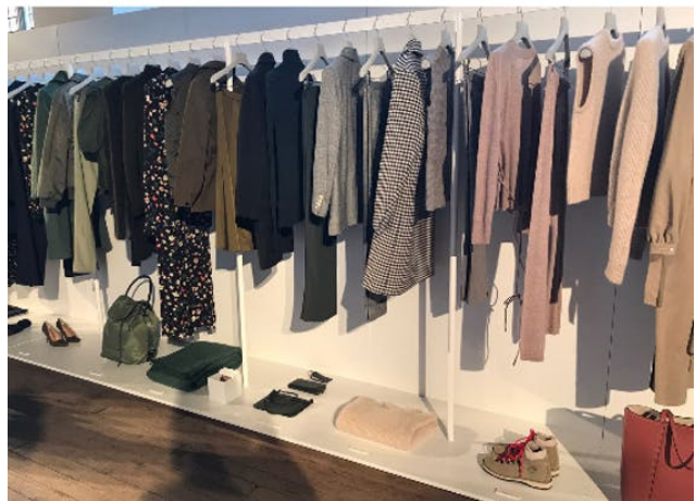
Arket winkel impressie