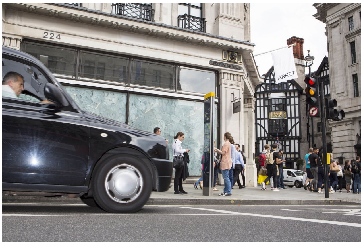
London new H&M brand store Arket will open on 25 august 2018 Regent Street London

Met Arket probeert H&M een plek te creëren waar zulke drukke mensen niet hoeven te wachten, maar juist willen komen. Anders dan in traditionele winkels wordt niet elke verkoopmeter benut. In de boetiek is er juist heel veel licht en ruimte 'om te ademen'. Geen stapels op demonstratietafels, maar aparte kledingstukken.